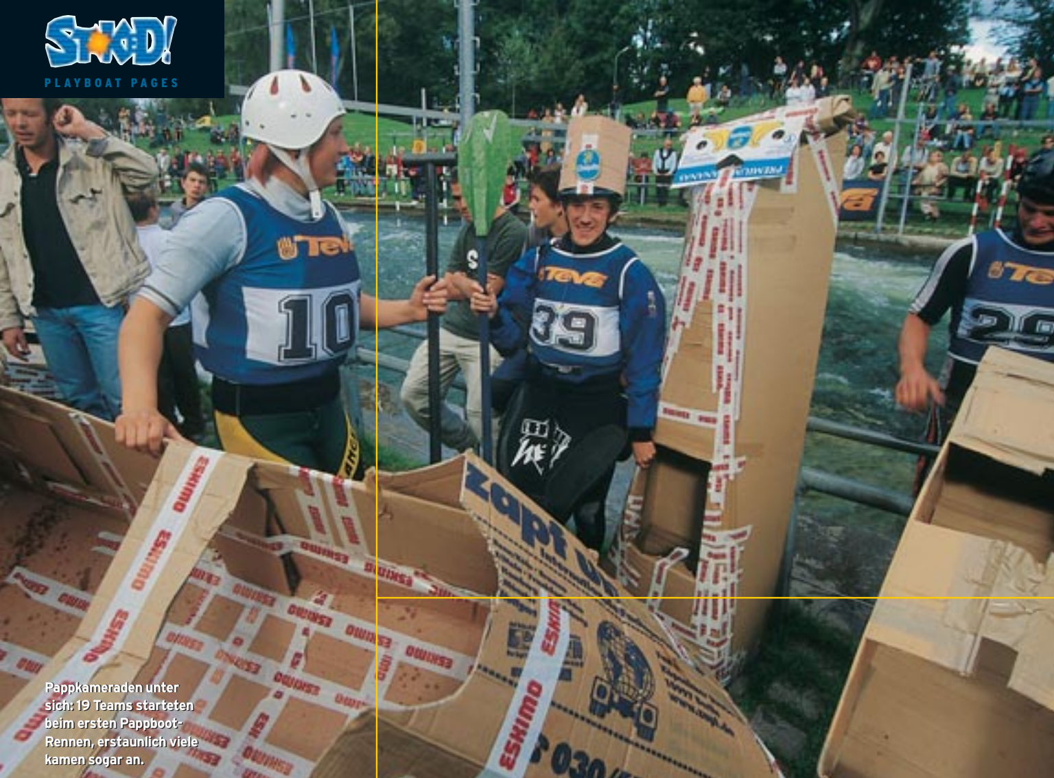
Pappkameraden unter sich: 19 Teams starteten beim ersten Pappboot-Rennen, erstaunlich viele kamen sogar an.